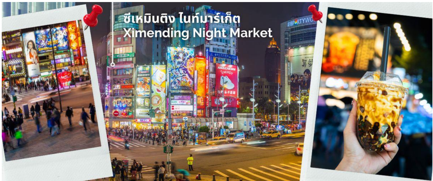
ซีเหมินติง ไนท์มาร์เก็ต Ximending Night Market

คำ อิสระอาหารค่ำ เพื่อให้ทุกท่านเต็มที่กับการช้อปปิ้งซึ่งไกด์จะแนะนำร้านอาหารร้านเด็ดร้านอร่อยให้