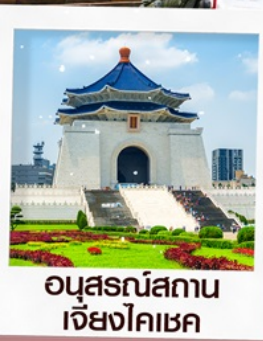
อนุสรณ์สถาน เจียงไคเชก