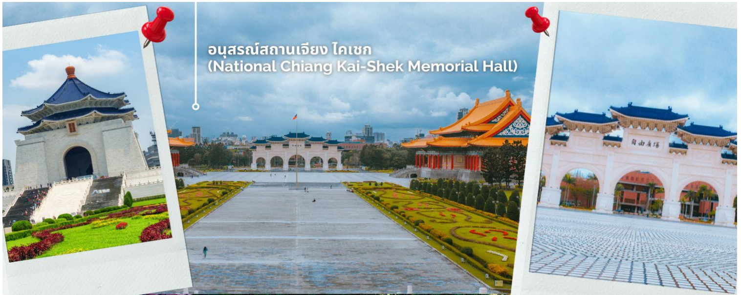
อนุสรณ์สถานเจียง ไคเชก (National Chiang Kai-Shek Memorial Hall)

ถูกสร้างขึ้นตามแบบสถาปัตยกรรมจีนโบราณ บันไดทั้งสี่ด้านถูกสร้างด้วยหินอ่อนสีขาวเป็นขั้นตามแบบ พีระมิดอียิปต์ หลังคาสีน้ำเงิน รวมทั้งยังมีสวนดอกไม้สีแดง ที่เป็นการแสดงออกทางสัญลักษณ์ให้เห็นถึง อิสรภาพ ความเท่าเทียม และความเป็นหนึ่งเดียวกัน ตามลี้ของธงชาติไต้หวัน