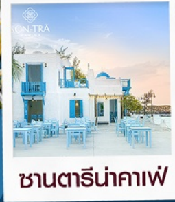
ซานตาน้ำกาแฟ