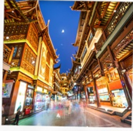
ตลาดเดินห้างเมี่ยว