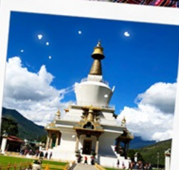
อนุสรณ์สถานทิมพู