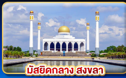
มัสยิดกลาง สงขลา