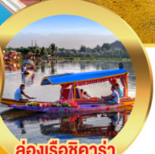
ล่องเรือซิคาร์่า