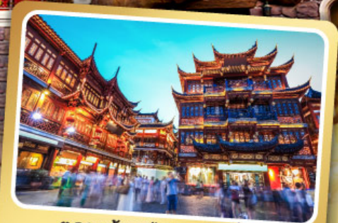
ตลาดร้อยปีเฉิงหวังเหมียว