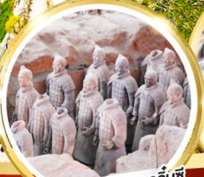
กองทัพทหารดินเผาจีนซี