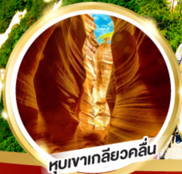
หุบเขาเกลียวคลื่น