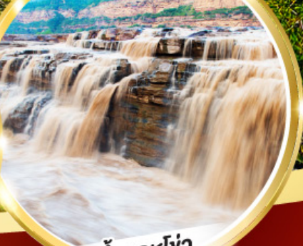
น้ำตกหูโจว