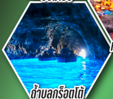
ถ้ำลูกรोटโต้