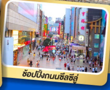
ช้อปปิ้งถนนซีลู่