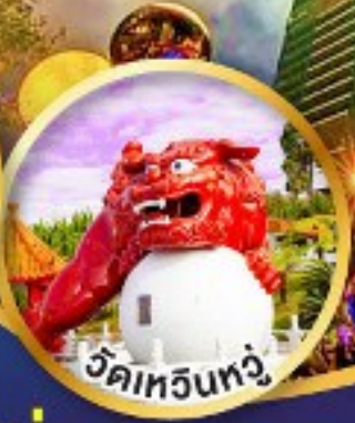
วัดเหวินทง