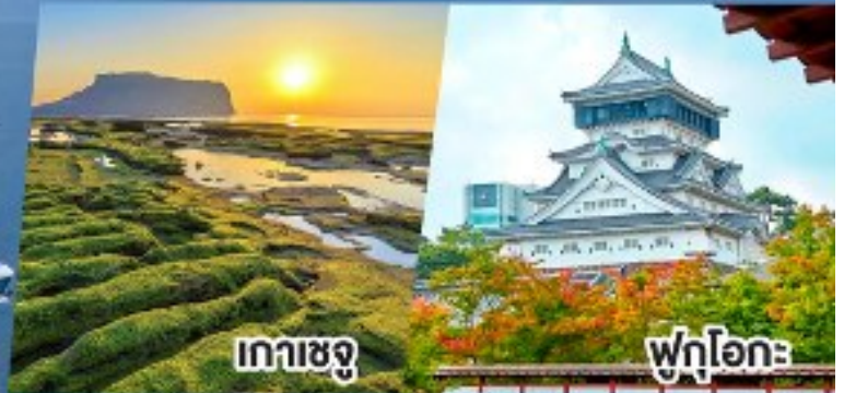
เกาะเชจู