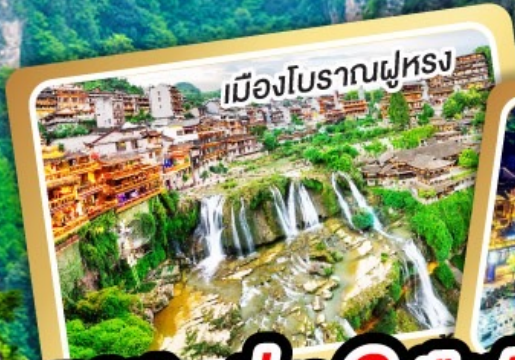
เมืองโบราณฟูหลง