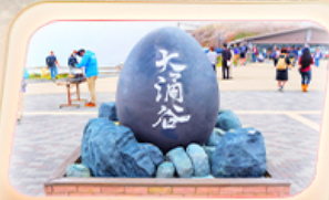
ชุมชนไร่ดำโอวาคุดานิ