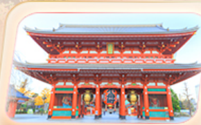
วัดฮาซากุสะ