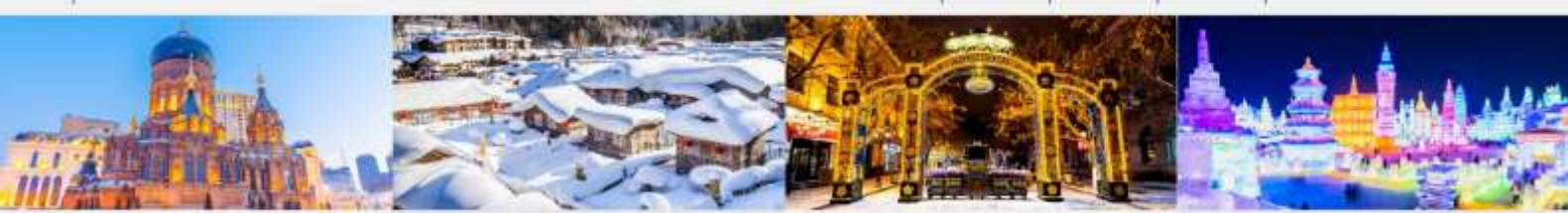
โบสถ์เซนต์โซเฟีย หมู่บ้านหิมะ ถนนคนเดินจงหยาง เทศกาลคอมไฟน้ำแข็ง

*ทางบริษัทฯ ขอสงวนสิทธิ์ในการสลับโปรแกรมทัวร์ตามความเหมาะสมขึ้นอยู่กับสถานการณ์หน้างาน โดยคำนึงถึงผลประโยชน์ของลูกค้าเป็นสำคัญ