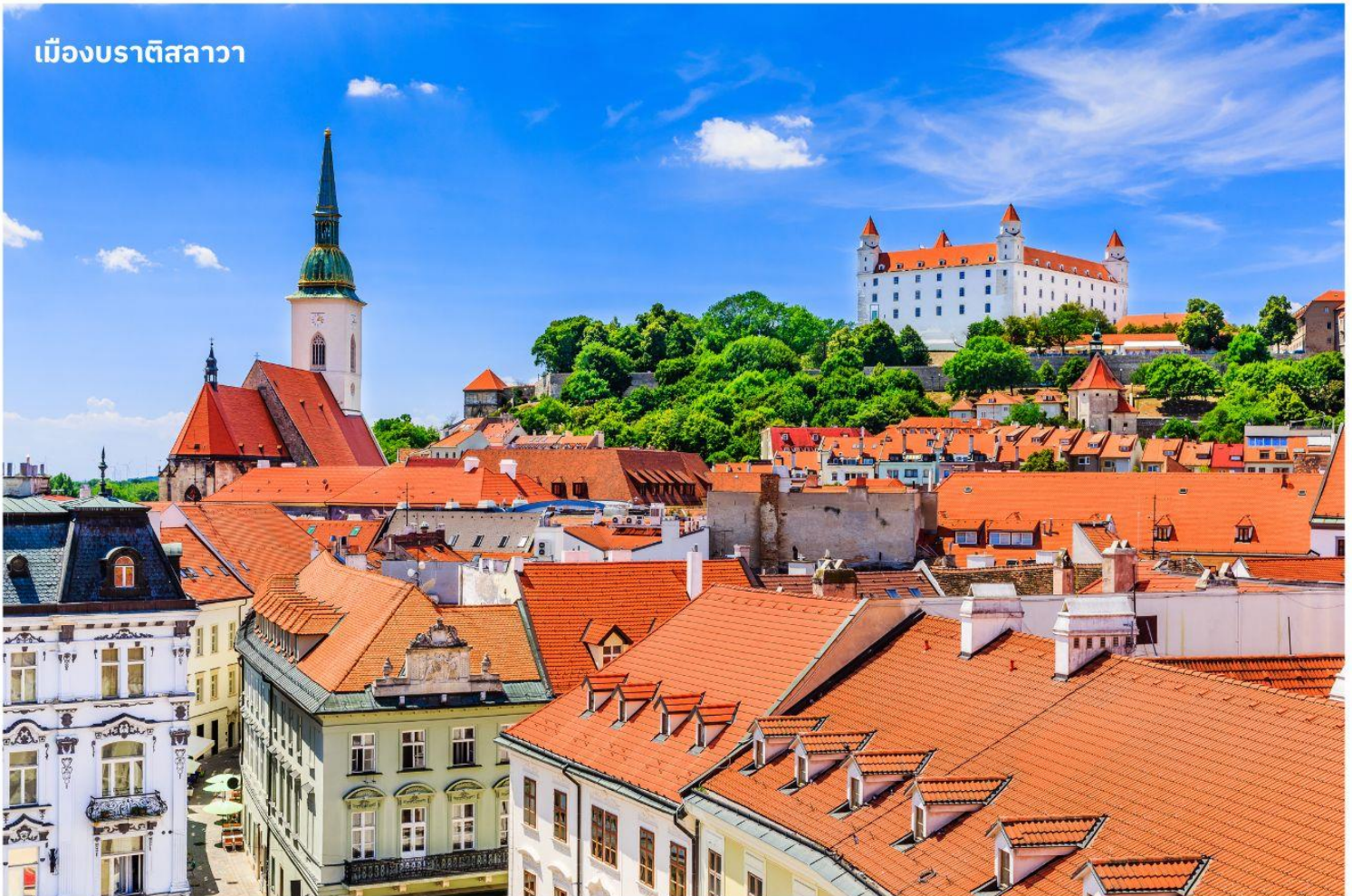
เมืองบราติสลาวา

จากนั้นนำท่านเดินทางสู่ เมืองบราติสลาวา ประเทศสโลวาเกีย ใช้เวลาเดินทางประมาณ 3 ชั่วโมง หรือมีชื่อเรียกอย่างเป็นทางการคือ สาธารณรัฐสโลวัก เป็นประเทศขนาดเล็กที่เพิ่งเข้าร่วมเป็นสมาชิกใหม่ของสหภาพยุโรป เป็นประเทศไม่มีทางออกสู่ทะเล แต่เมืองหลวงแห่งนี้เป็นเมืองที่มีชีวิตชีวาและยังเต็มไปด้วยวัฒนธรรมเก่าแก่ จากนั้นนำท่านถ่ายรูป ปราสาทบราติสลาวา ปราสาทเก่าแก่ที่ตั้งอยู่เหนือแม่น้ำดานูบ เมื่อขึ้นไปบนจุดที่ตั้งของปราสาทจะมองเห็นวิวทิวทัศน์เมืองสโลวาเกียได้ทั่วทั้งเมือง จากนั้นนำท่านเดินทางสู่ ย่านเมืองเก่าบราติสลาวา เป็นที่ตั้งของ ประตูมิคาเอล (Michael's Gate) เป็นประตูและป้อมปราการของเมืองเพียงแห่งเดียวที่ยังคงถูกเก็บรักษาไว้ตั้งแต่สมัยศตวรรษที่ 14