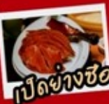
เป็ดย่างซีอาน