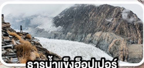
ธารน้ำแข็งอีปเปอร์