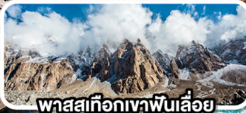
พาสสูเทือกเขาพินเลื่อย

เดินทาง 08-16 ก.พ. 68 (วันวาเลนไทน์, วันมาฆบูชา)