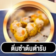
ต้มซ่าต้นตำรับ