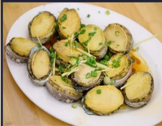
เป่าฮ้อสดหนึ่ง