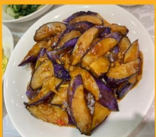
มะเขืออบหม้อดิน