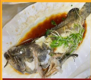
ปลาหนึ่งซีอิ้ว