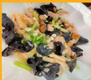
ไก่ผัดเห็ดหูหนู