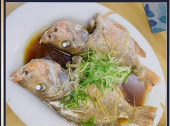
ปลาหนึ่งซีอิ๊ว