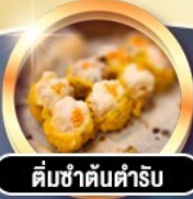
ติ่มซำต้นตำรับ

การ์ดี!! พักหรู 4 ดาว THE KOWLOON HOTEL ติดถนนนาธาน ย่านช้อปปิ้งจิมซาจู้