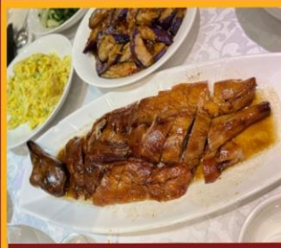
ท่านอย่าง