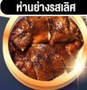
ห่านย่างสไลซ์