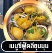
เมามูซึฟู้ดลี่ยูนนุ