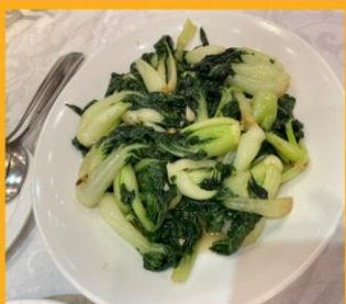
ผัดผักตามฤดูกาล