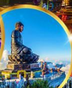
ฟานซีปัน