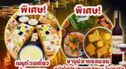
พิเศษ! เมนูถ้วยเต๋อชว่ ซ้ำสามรส