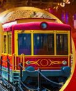
รถรางซาปา