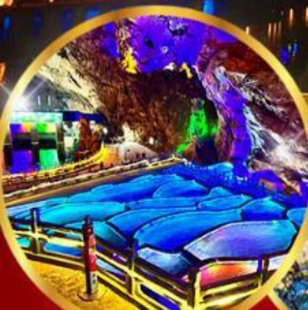
ถ้ำนกนางแอ่น