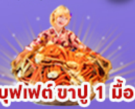
บุฟเฟต์ ชาปู 1 มือ

45,919 ราคา เที่ยว รวมภาษีมูลค่าเพิ่ม 7%