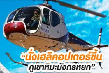
"นั่งเฮลิคอปเตอร์ขึ้น ภูเขาหิมะมังกรหยก"