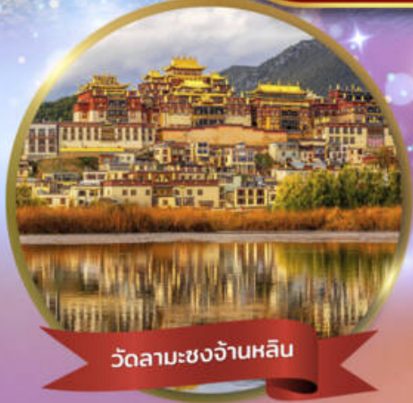
วัดลามะชงจ้านหลิน