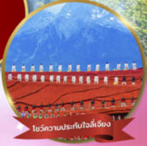
โชว์ความประทับใจลี่เจียง