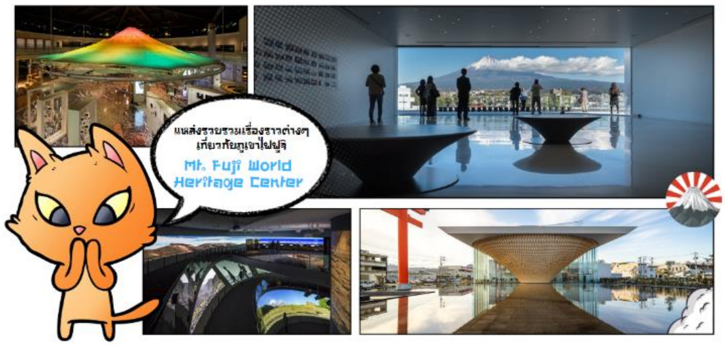
แหล่งรวบรวมเรื่องราวต่างๆ เกี่ยวกับภูเขาไฟฟูจิ Mt. Fuji World Heritage Center

เดินทางสู่ พิพิธภัณฑ์ภูเขาไฟฟูจิ เวิร์ลเฮอริเทจเซ็นเตอร์ (MT. FUJI WORLD HERITAGE CENTER) พิพิธภัณฑ์ที่บอกเล่าเรื่องราวของภูเขาไฟฟูจิ ภูเขาที่สูงที่สุดในประเทศญี่ปุ่น และภูเขาถูกนี้ได้รับการขึ้นเป็นมรดกโลกในปี ค.ศ.2013