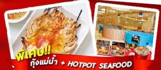
พิเศษ!! ก๊วยแม่ น้ำ + HOTPOT SEAFOOD