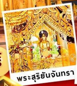
พระสุริยันจันทรา