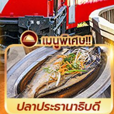
เมนูพิเศษ!! ปลาประดานาธิบดี