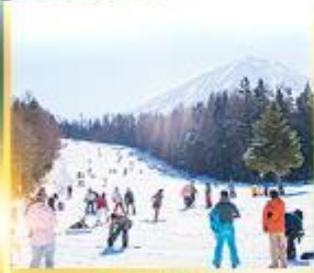
ลานสกีฟูจิเท็น