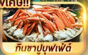
กินชาบูบุฟเฟ่ต์