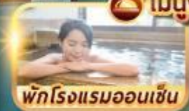
พักโรงแรมออนเซ็น