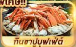
กินซาปูบุฟเฟ่ต์