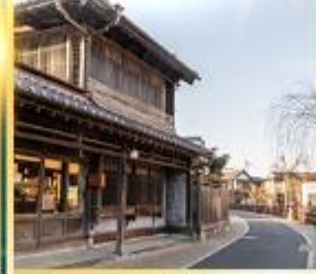
ย่านเมืองเก่าซาวาระ