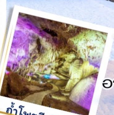
ถ้ำไฟรมีเทียส