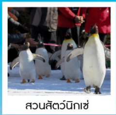
สวนสัตว์นิกเซ่

วัดคิตสึอิชิ / ปราสาทโอซาก้า / ย่านชินไซบาชิ ค่องเรือทะเลสาบโทเยะ / โทริยวคะกุ ทาวเวอร์ โกดังอิฐแดงคามาโมริ / นั่งกระเช้าภูเขาฮาโกดาเตะ ตลาดเช้าเมืองฮาโกดาเตะ / สวนสัตว์นิกเซ่ ภารินพาร์ค พิพิธภัณฑ์ค่องดนตรี / นาฬิกาไอน้ำโบราณ โรงเป่าแก้วคิตาอิชิ / เนินพระพุทธรเจ้า / มิซึย เอ้าเค็ทท์