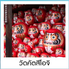
วัดคิตสึอิชิ