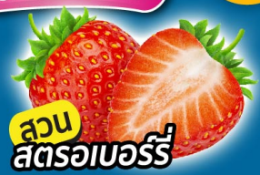
สวน สตรอเบอร์รี่