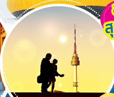
NEW! มุมลับ! หอคอย N โซล