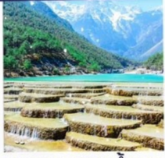
ทะเลสาบธารน้ำขาว รวมรถเช่าเตอร์รี่