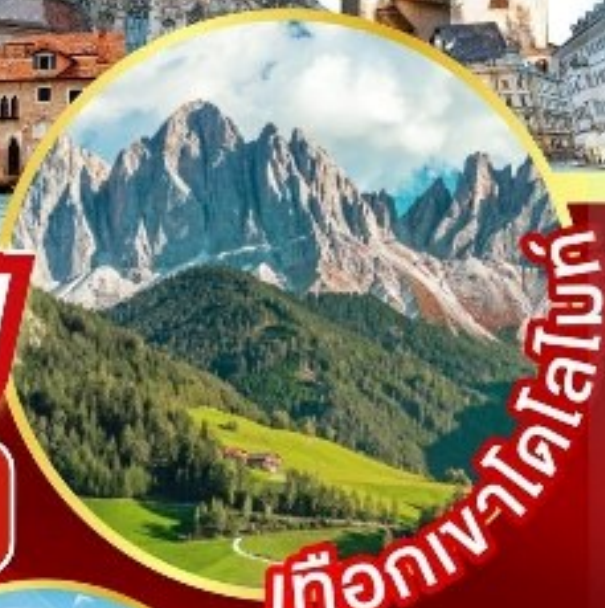
เทือกเขาโตโลมัต