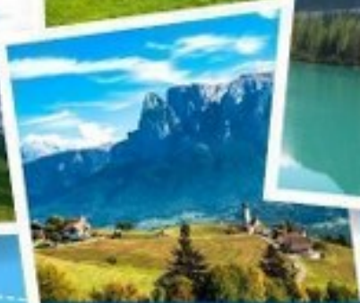
เมืองโบลซาโน