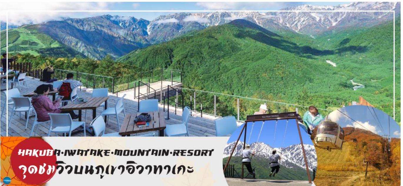
HAKUBA IWATAKE MOUNTAIN RESORT จุดชมวิวนภูเขอิวาทาเกะ

วันที่สี่ เมืองมัตสึโมโตะ – เมืองนากาโนะ – ฮาคูบะ – HAKUBA IWATAKE MOUNTAIN RESORT (คอนโดล่า ลิฟท์) – ไร่อาซาฮิไดโอะ – เมืองยามานาชิ – อุโมงค์ไบเมเบิล (ขึ้นอยู่กับฤดูกาล) – หมู่บ้านโอชิโนะสั๊กไก – ออนเซ็น + ชาบูยักษ์