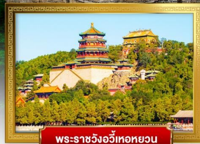
พระราชวังอู่เหอหยวน