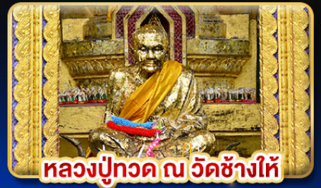
หลวงปู่ทวด ณ วัดช้างไห้