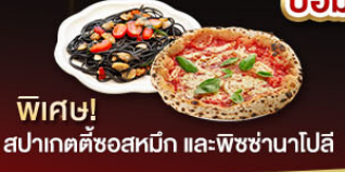
พิเศษ! สปาเกตตี้ซอสหมัก และ-พิซซ่านาโปลี