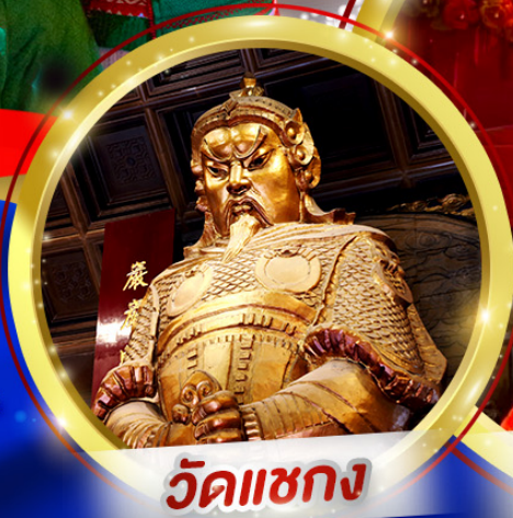
วัดเซกวง