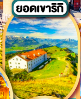
ยอดเขารีกี