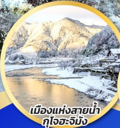
เมืองแห่งสายน้ำ กุโจะจิมัง