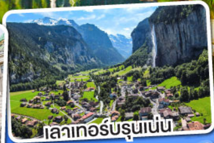
เลาเกอร์บรุนเนน

เดินทาง 12-18 มี.ค. 68 28 มี.ค.-03 เม.ย. 68 10-16 เม.ย. 68 29 เม.ย.-05 พ.ค. 68