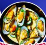
หอยแมลงภู่นิวอิงา