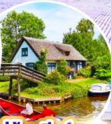
หมู่บ้านกีร์ช