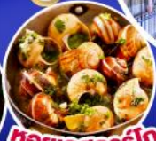
หอยเอสคาร์โก