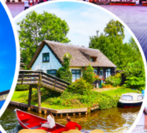
หมู่บ้านกีธูร์น