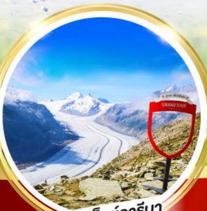
อาเล็กซ์อาร์นา