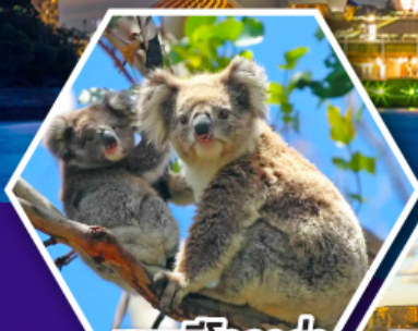
ชมหมีโคอาล่า ณ สวนสัตว์ซิดนีย์