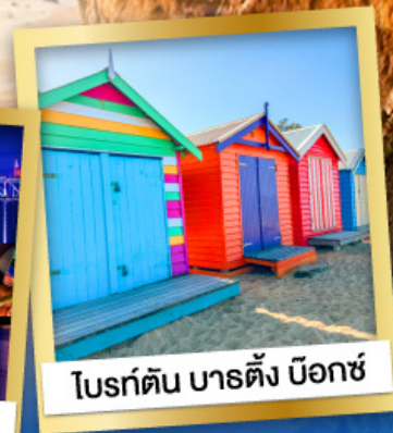
โบรด์ตัน บาร์ตัง บ็อกซ์