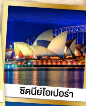
ซินีโยโอเปอร์่า