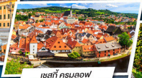
เซสกี ครุมลอฟ