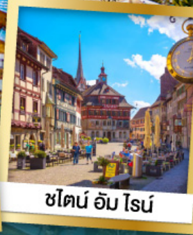
ซึร์ริช อัม โรส