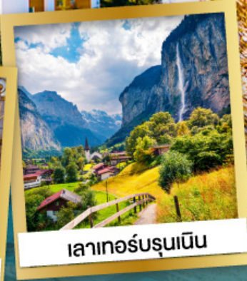
เลาเทอร์บรุนเนิน