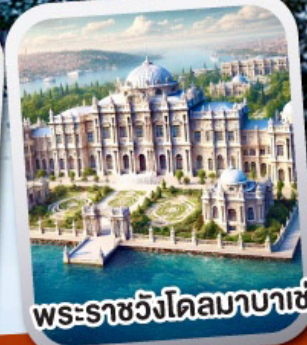
พระราชวังโดลมาบาเซ