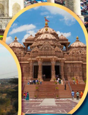
วิหารอักซาร์คัม